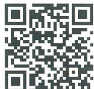
地図・パーキング情報

駐車場が無い会場が多いため、公共交通機関をご利用いただくか、お車でお越しの場合は、お近くのコインパーキングをご利用ください。